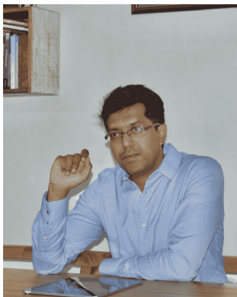
By NEEKHIL BHOWONIAH WORLD BANK FINANCIAL SECTOR EXPERT FOR MAURITIUS AND SEYCHELLES; AND UNITED NATIONS FAO ACCREDITATION EXPERT FOR THE GREEN CLIMATE FUND READINESS FOR MAURITIUS